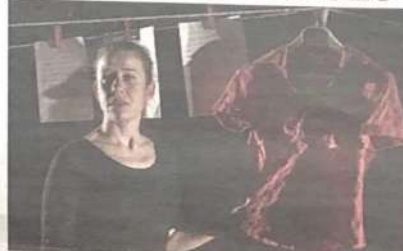
L'attrice e autrice del testo teatrale che racconta una storia vera