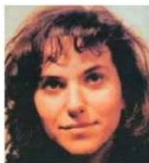
Rita Atria, la testimone di giustizia morta nel 1992, una settimana dopo lo strage di via D'Amelio

«Ci siamo concentrati sul percorso personale di Rita, ritenendolo più interessante perché ci parla di un essere umano, senza alcun super potere, che però trova il coraggio e la forza di scegliere quale sia la strada giusta per vivere all'interno di questa società come cittadina che contribuisce al bene comune. No-